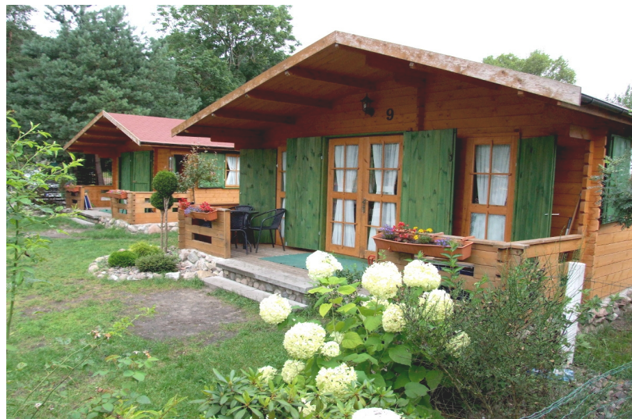
Ośrodek Wypoczynkowy w Jeleniu